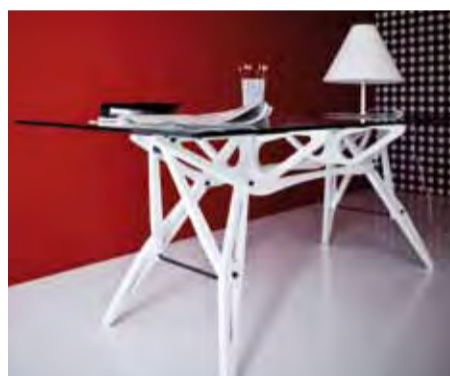
Tisch „Reale“, Zanotta