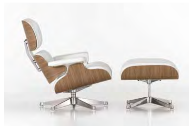
„Eames Lounge Chair“ – den Vitra Klassiker gibt es jetzt in zwei verschiedenen Größen

Fragen Sie uns bei Ihrem nächsten Besuch nach Ihrem persönlichen VitraHaus Schlüssel!