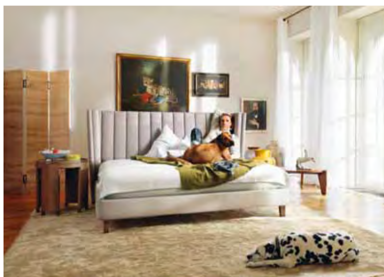
Paravent „Manhattan“, Beistelltisch „Soho“, Bett „Brooklyn“