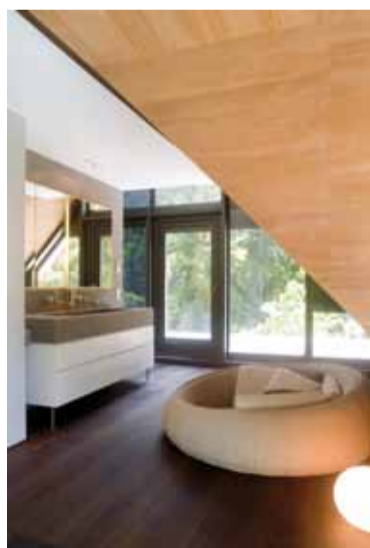
Blick vom Schlafbereich ins offene Bad