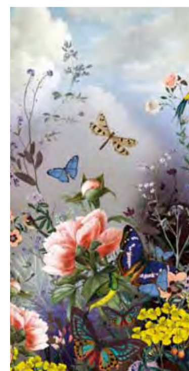
Tapete „Remus Pomona“ von Jakob Schlaepfer