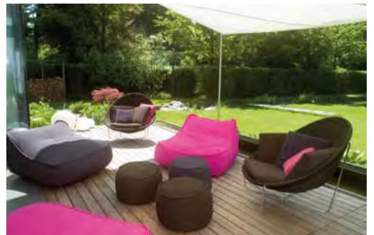
Loungebereich auf der Terrasse