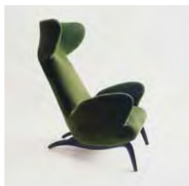
Armlehnstuhl für Casa Minola, 1946