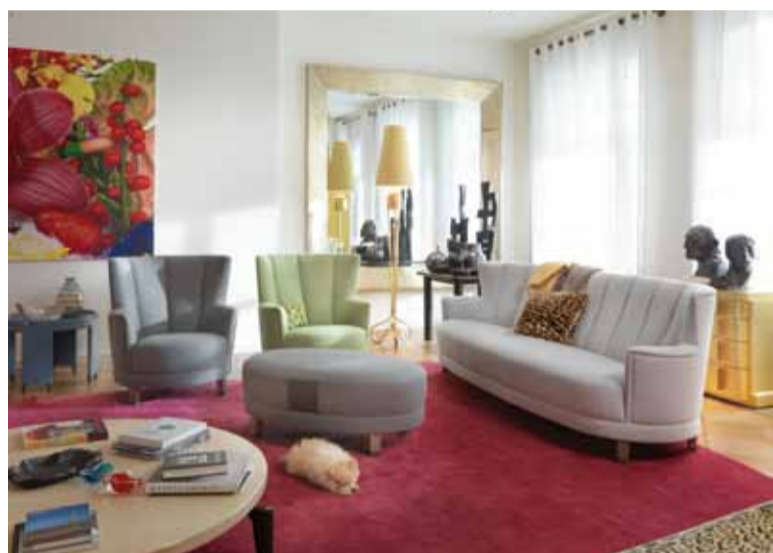
Sessel, Sofa und Hocker „Harlem“ sowie Beistelltisch „Soho“

Herr Joop, wir danken Ihnen für das Gespräch.