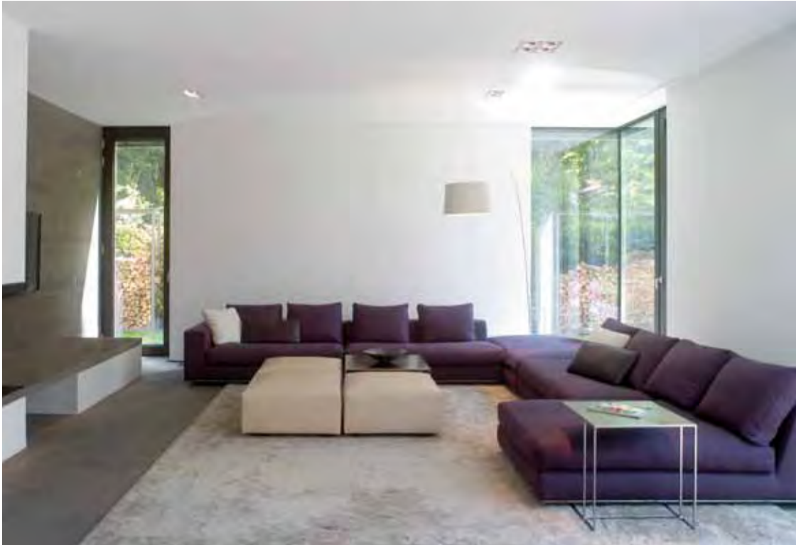
Wohnraum mit Kamin

Das freistehende Einfamilienhaus im Münchner Nordwesten steht in einem wunderschönen parkähnlichen Garten. Die Inneneinrichtung ist perfekt auf die großzügige Architektur abgestimmt