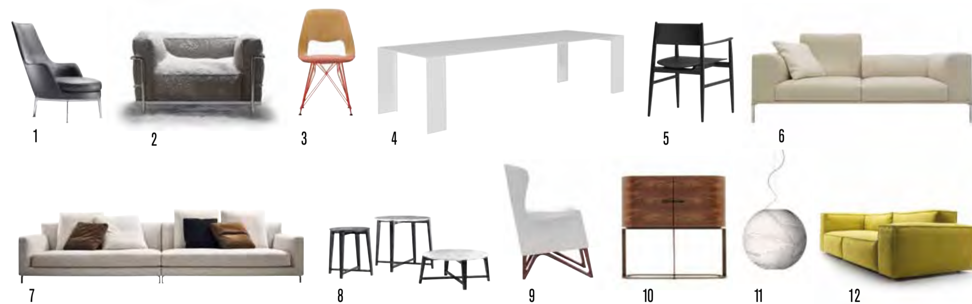
1 Sessel „Guscioalto“ v. Flexform, 2 Sessel „LC3 Outdoor“ v. Cassina, 3 Stuhl „Jill“ v. Vitra, 4 Tisch „Metallico“ v. Porro, 5 Stuhl „Neve“ v. Porro, 6 Sofa „Moov“ v. Cassina, 7 Sofasystem „Allen“ v. Minotti, 8 Beistelltische „Tris“ v. Flexform, 9 Sessel „Mobius“ v. Giorgetti, 10 Barschrank „Ino“ v. Giorgetti, 11 Hängeleuchte „Planet“ v. Foscarini, 12 Sofasystem „Neowall“ v. Living

Das Team der Neuen Werkstätten war auf der Mailänder Möbelmesse wieder als Trendscout für Sie unterwegs. Bei den wichtigsten italienischen Herstellern stehen edle Materialien, klassische Formensprache, hochwertige Ausführungen, Dauerhaftigkeit und Nachhaltigkeit im Fokus. Bequemlichkeit und Funktionalität sind angesagt, ebenso Klassiker für den Outdoor-Einsatz