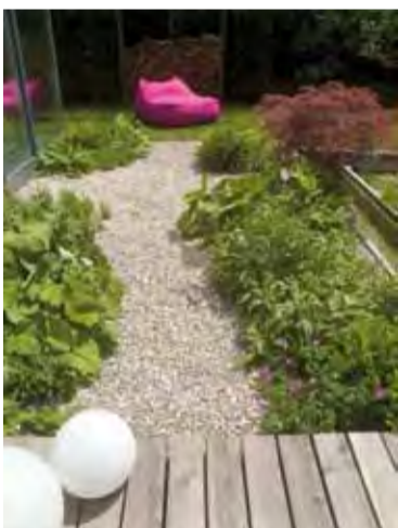
Ruheplatz am Wasserlauf