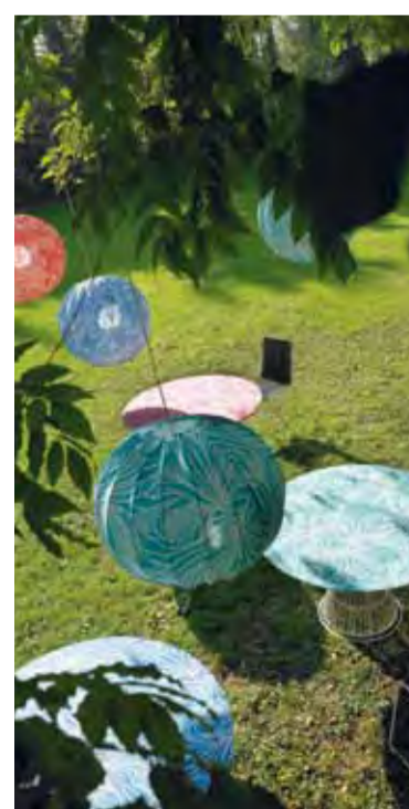
Kollektion „Outdooruno“ von Missoni

Auch Jakob Schlaepfer ist immer für eine Überraschung gut. Die Kollektion 2011 enthält eine Serie von außergewöhnlichen Tapeten. Großflächige, dekorative Muster, Blumen, Schmetterlinge, Vögel breiten sich über die ganze Wand aus, werden individuell auf Maß produziert – eine Augenweide!