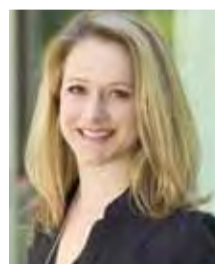
Konzeption und Planung Rebecca Jäger

Die unkomplizierte Zusammenarbeit hat uns sehr viel Freude bereitet.