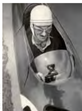
Carlo Mollino in seinem „Bisiluro“ Rennwagen, 1955

Architekt, Designer, Dandy, Rennfahrer und vieles mehr war Carlo Mollino (1905 – 1973) – heute gilt er als eine Ikone der 50er Jahre. Das Haus der Kunst widmet ihm vom 16.09.2011 bis zum 08.01.2012 mit der Ausstellung „Maniera Moderna“ die erste umfassende Präsentation im deutschsprachigen Raum. Zu sehen sind auch einige seiner absolut außergewöhnlichen Möbelentwürfe: Stühle können aussehen wie Rehe, Rückenlehnen wie Skier.