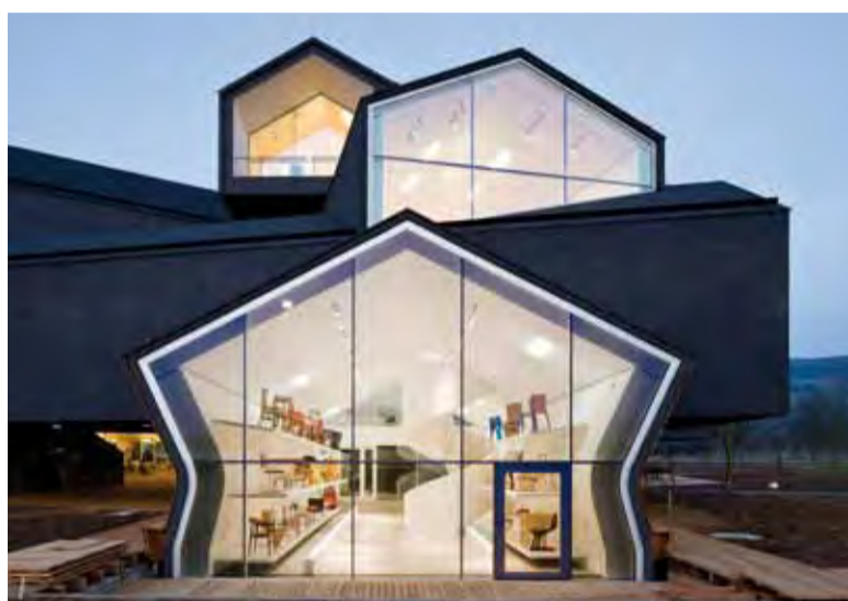
Das VitraHaus in Weil am Rhein

Mit der Chip-Karte erhalten Sie den Zutritt zum VitraHaus und können alle Informationen zu den ausgestellten Produkten abrufen. Wir haben Ihren persönlichen Schlüssel für Sie reserviert