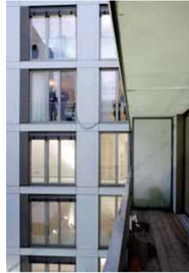
Balkon zum Innenhof