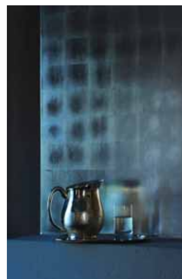
Versilberung einer Kaminwand in Echtsilber

Rudolf Lang OHG Ehrwalder Straße 120 81377 München Tel. +49 89 74 15 10 0 www.rudolf-lang.de