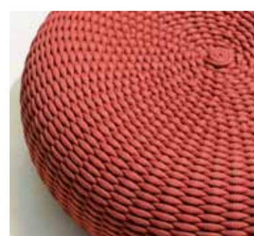
Pouf „Shell“, Geflecht „Rope“