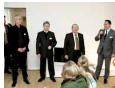
Die Gastgeber stellen das Projekt vor

und formal reduziert. Das große Ecksofa strahlt lässige Lounge-Atmosphäre aus und lädt dazu ein, es sich bequem zu machen. Farbkontraste kommen mit roten Stühlen, Teppichen in Grautönen sowie schwarzen Accessoires und Leuchten ins Spiel. Im Eingangsbereich und im Schlafraum