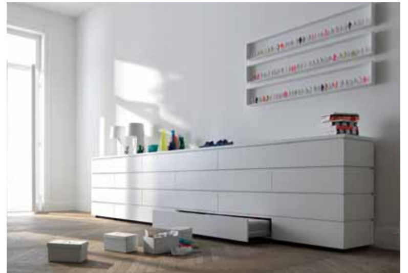
„cube“, Design: Werner Asslinger

„cube x“ entwickelt das Konzept weiter: Neue Breitenmaße, filigrane Abdeckplatten, flachere Sockel und feiner ausgearbeitete Fronten lassen eine elegante Optik mit schlanker Silhouette entstehen. Neue Farben in Matt- oder Hochglanzlack erweitern die Gestaltungsmöglichkeiten.