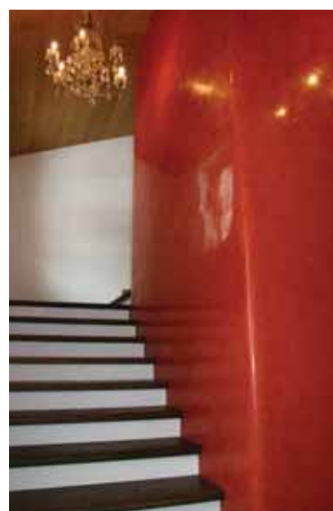
Treppenaufgang in Stuccolustro-Technik

Wir bieten Tadelakt in München exklusiv an. In Deutschland beherrschen nur ganz wenige handverlesene Betriebe diese Technik. Um unsere Mitarbeiter zu schulen, haben wir eigens einen Spezialisten kommen lassen. Generell integrieren wir laufend neue Techniken – durch Auswärtsschulungen oder durch Trainer, die wir nach München holen.