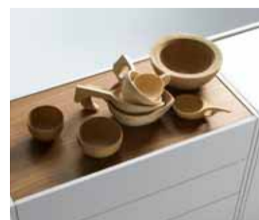
„algo“, Design: Rolf Heide