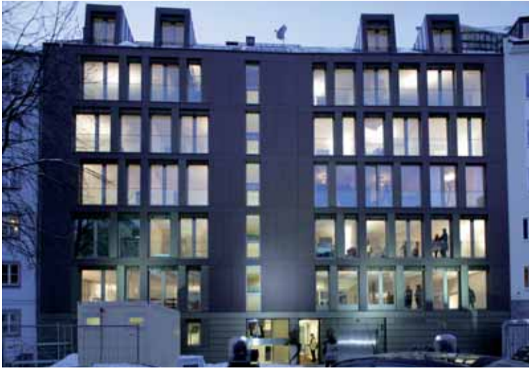
Fassade zur Lilienstraße

Vor dem Kleiderkauf kommt das Anprobieren, vor dem Weinkauf die Verkostung, vor dem Wohnungskauf: nichts – bis jetzt: Bauwerk Capital präsentiert ein zukunftsweisendes Konzept