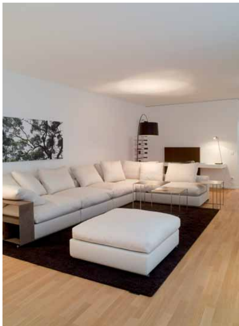
Der großzügige Wohnraum