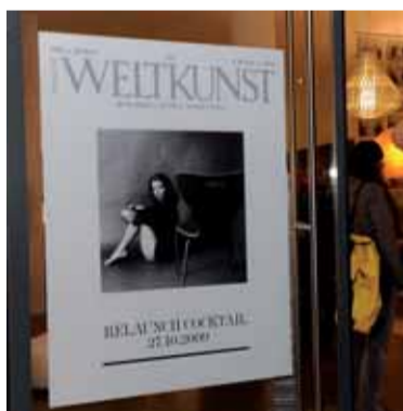
WELTKUNST mit neuer Titeloptyk

Die Kunstzeitschrift WELTKUNST feierte am 27. Oktober 2009 am Promenadeplatz ihren Relaunch