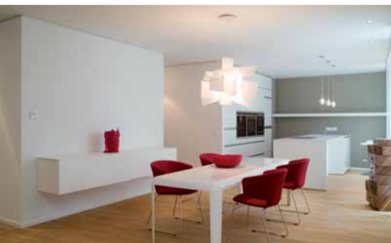
Essbereich mit offener Küche

Das Konzept des Probewohnens ist in Deutschland einzigartig. In den Neuen Werkstätten hat Bauwerk Capital einen Partner, der diesen innovativen Weg konsequent mitgeht.