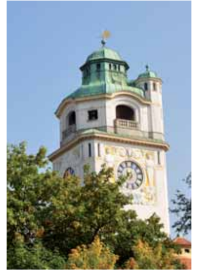
In nächster Nähe: das Müller'sche Volksbad

Im März 2010 wird in der Lilienstraße 10 ein neues Projekt von Bauwerk Capital mit modernen Eigentumswohnungen fertiggestellt. Erstmals haben Interessenten die Möglichkeit, dort einige Tage Probe zu wohnen. Die Neuen Werkstätten haben dafür eine Musterwohnung komplett eingerichtet.