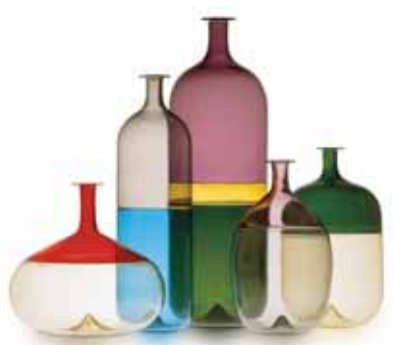
Glasobjekte „Bolle“, Design Tapio Wirkkala

Das 1921 gegründete Unternehmen lädt immer wieder berühmte Designer und Architekten wie Alessandro Mendini, Rodolfo Dordoni und Ettore Sottsass zur Zusammenarbeit ein. 180 verschiedene Farbtöne werden eingesetzt und eine Vielzahl höchst anspruchsvoller, rein handwerklicher Herstellungstechniken. Jedes Stück ist ein absolut einmaliges Original. Die limitierten und nummerierten Auflagen sind inzwischen bei Sammlern auf der ganzen Welt begehrt.