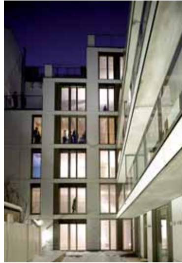
Fassade zum Innenhof