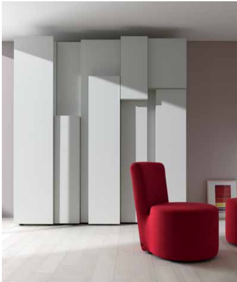
„reef“ – Skulptur und Wohnprogramm zugleich. Design: Neuland Industriedesign

Auf der imm cologne 2010 waren viele inspirierende Produkte und Weiterentwicklungen zu sehen. Besonders beeindruckt haben uns die Neuheiten von interlücke