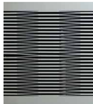
Design: Lignum Arts

Ästhetisch und technisch einzigartig, besitzt dieser innovative Tisch zwei Gesichter: Normalerweise zeigt „DIVERSO“ seine geschlossene furnierte Oberfläche. Wird er ausgezogen, offenbart er sein unverwechselbares Scherendesign. Während Auszugtische gewöhnlich in der Länge größer werden, zeigt „DIVERSO“ seine Stärken in der Breite auf höchstem handwerklichem Niveau: Das Tischblatt lässt sich ohne Einlegeplatten oder Zusätze durch einfaches Kurbeln verändern. Ein Meisterwerk!