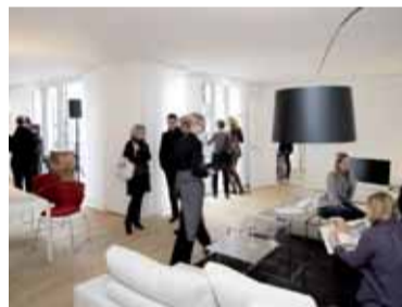
Eröffnung der Musterwohnung

Die Musterwohnung in der Lilienstraße 10 ermöglicht es, die Atmosphäre des Gebäudes und des Stadtviertels gegen einen angemessenen Kostenbeitrag hautnah zu erleben. Der Stil der Einrichtung folgt dem Stil des Gebäudes