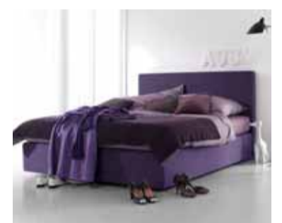
„faenum“ – Polsterbett

Technisch ist die x-Version absolut up-to-date: Die eingebauten „Sensor-matic“ Schubladen öffnen sich bei leichtem Antippen wie von Zauberhand. Weitere Extra-Features: zum Beispiel bündig eingebaute, beleuch-