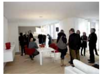
Informativ und kommunikativ

aus der Serie „Occhio“ ausgewählt. Schlichte Schiebepaneele an den Fenstern sorgen für Sichtschutz und bleiben doch transparent. Die großformatige Fotoarbeit von Hubertus Hamm zeigt australische Eukalyptusbäume und vermittelt Natur-Feeling mitten in der Stadt.